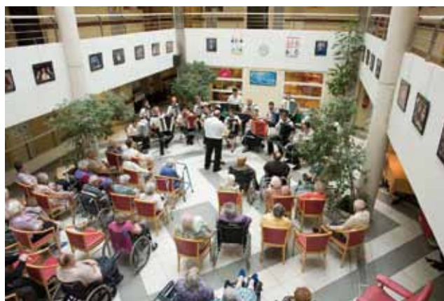
Concert de l'Orchestre d'Accordéons de Paris et exposition de photos de P. Esteffe à la maison de retraite de l'hôpital Longjumeau

Nous mettons au premier plan de nos préoccupations l'écoute, le partage et la prise en compte des besoins des personnes hospitalisées . Ainsi, nous leur proposons toute une palette de styles musicaux, de formations, de lieux d'interventions. Nous attachons également beaucoup d'importance à la proximité et à l'accessibilité des artistes de GRADISCA afin de partager au mieux les plaisirs et les émotions qui voient le jour lors des actions artistiques que nous menons. Enfin, nous sommes attentifs à ce que tous les intervenants soient formés aux besoins des personnes auxquelles ils s'adressent et soient ainsi à même de s'adapter au rythme de chacun.